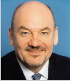
Matthias Kurth Präsident der Regulierungsbehörde für Telekommunikation und Post

„Das seit November 2002 zusätzlich verfügbare Spektrum für WLAN-Anwendungen soll der mobilen Datenkommunikation in Deutschland einen zusätzlichen Innovationsschub geben. WLAN und UMTS werden sich ergänzen und die Nachfrage nach mobilen Angeboten und Dienstleistungen fördern. Die Allgemeinzuteilung von immerhin 455 MHz Bandbreite im 5 GHz-Bereich stellt sicher, dass keine zusätzliche Kostenbelastung für die Inanspruchnahme dieses Spektrums entsteht und Störungen in diesem Spektrumsbereich vermieden werden können.“ WLAN eignet sich besonders zur Realisierung des drahtlosen Internetzugangs an so genannten „Hot-spots“, wie Flughäfen, Bahnhöfen, Hotels, Cafes oder Einkaufszentren. Darüber hinaus werden durch die Möglichkeit des Datenaustauschs mit hohen Übertragungsraten, z. B. zwischen verschiedenen Gebäuden von Hochschulen, Krankenhäusern oder Firmenkomplexen vielfältige Nutzungsmöglichkeiten erschlossen und damit der zunehmenden Bedeutung des stetig wachsenden Datenkommunikationsbedarfs in Unternehmen, Wissenschaft und Verwaltung Rechnung getragen.